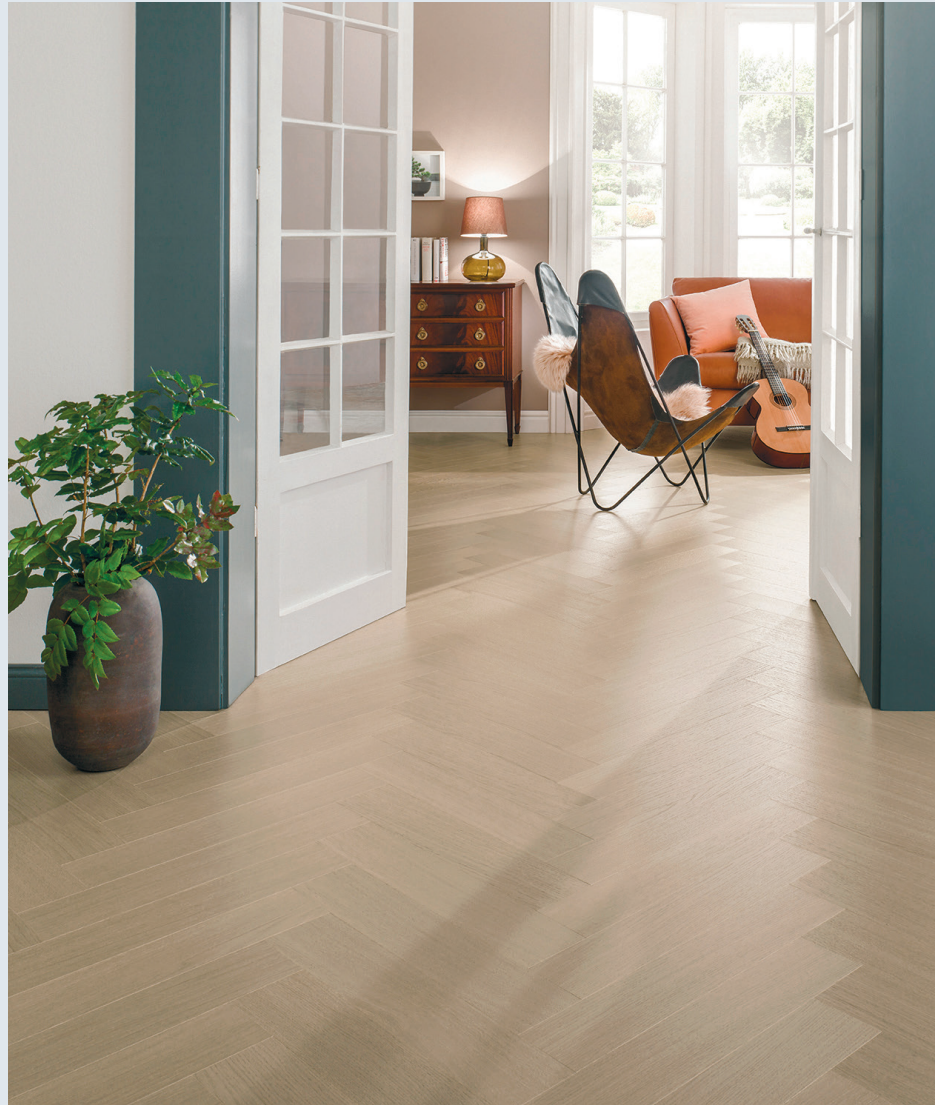
Parkey-puulattia Swing 06 Desert Oak Premium

– Jo nyt dokumentoimme tarkasti projekteissamme, mitä sisustusmateriaalit tarkkaan ottaen pitävät sisällään. Tämä on kriittinen tieto koko rakennuksen tai sen tiettyjen osien tullessa käyttöikänsä päähän. Kun voimme näyttää varmasti, mitä materiaalit ovat niin sanotusti syöneet, voidaan ne helpommin ja tehokkaammin hyödyntää myös uudelleen uusien materiaalien valmistuksessa, Puputti kuvailee. ●