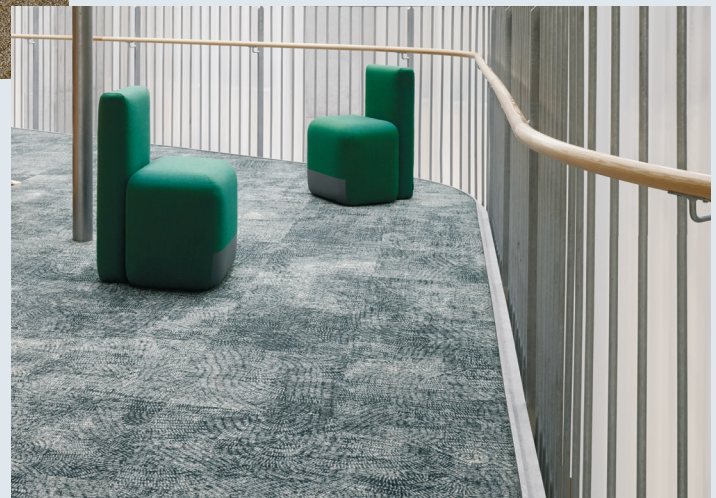
Ege Highline Tiles

– Esimerkiksi tuotteiden valmistaminen massatuotannon sijaan niiden lopullisen käyttökohteen ehdoilla vähentää tehokkaasti hävikkiä eli tuosäästöjä. Tämä on ehdottomasti kannatettava toimintamalli niin hankkeiden eri osapuolten kukkaroiden kuin myös ympäristön kannalta.