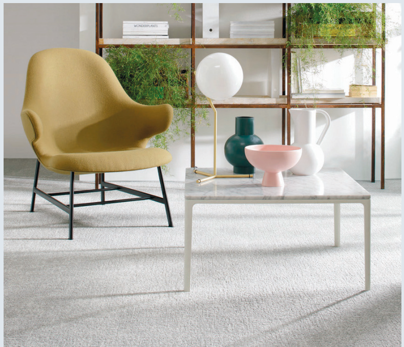
Milliken Tracing Landscapes Field Study