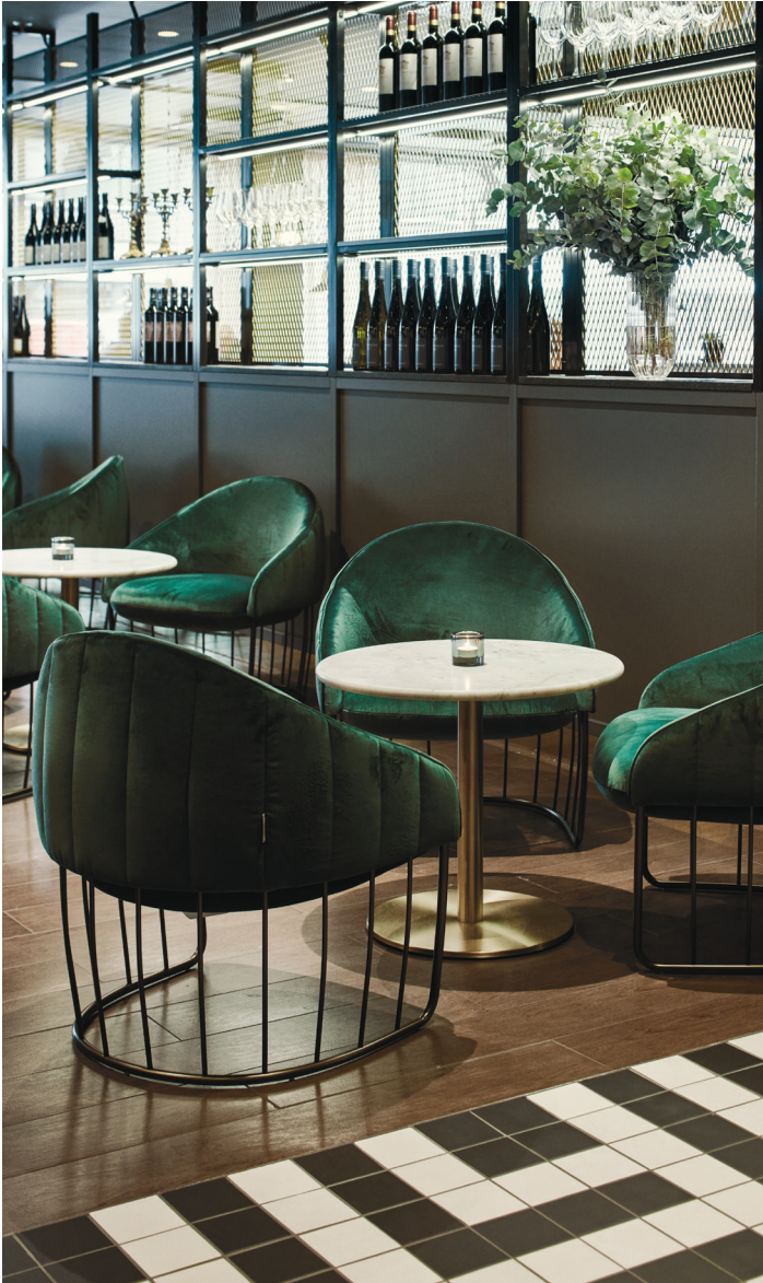
Sokos Hotel Vaakunaan valittiin Parky-puulattioiden Deluxe-malliston Antique Oak premium.